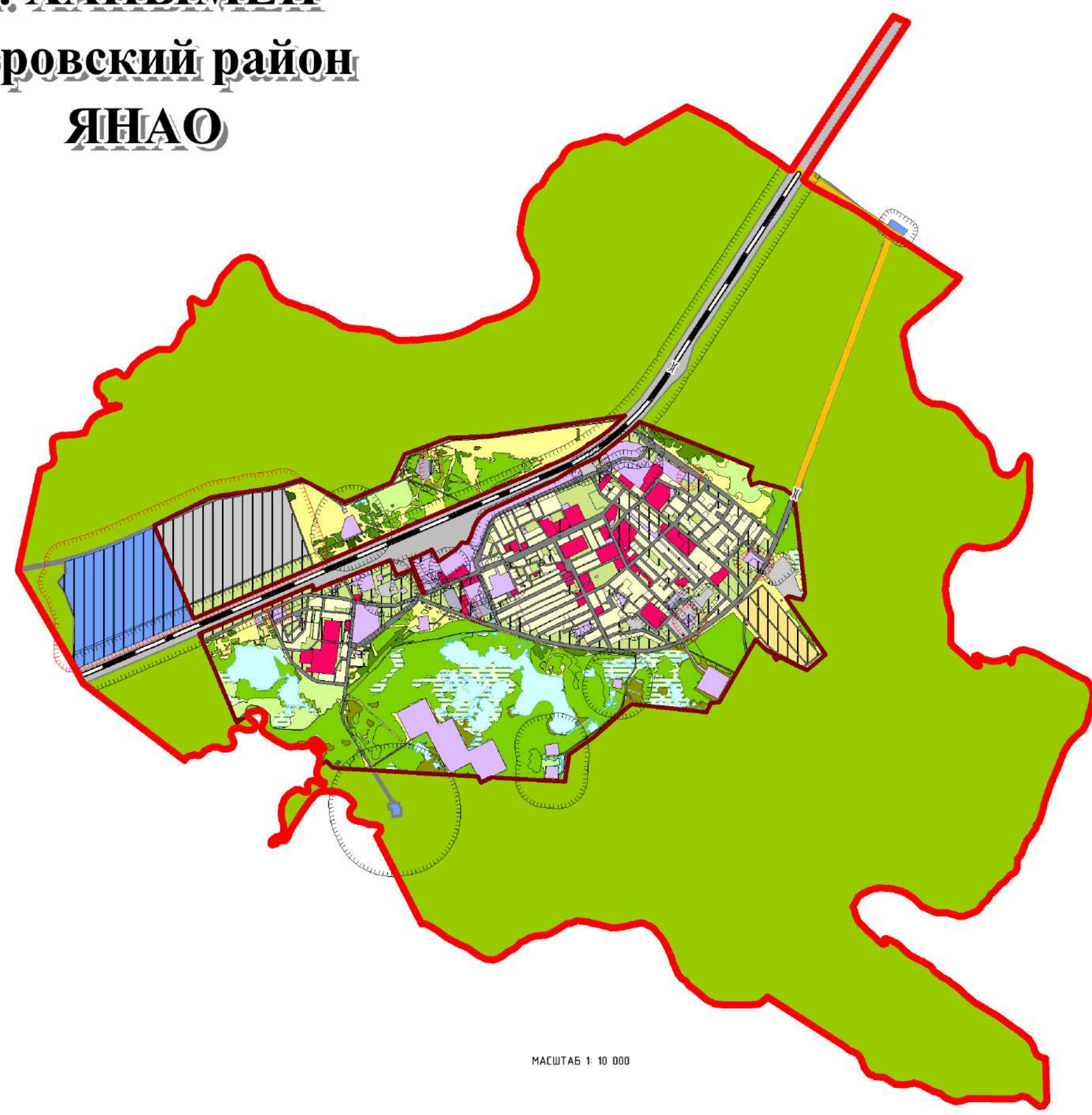
МАСШТАБ 1:10 000